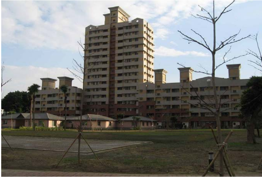
實踐大學高雄校區「高雄衛理學生中心」